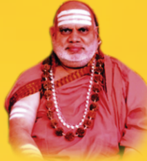
దక్షిణామూర్త్యుగేరి శారదావీర మహా సన్నిధానం వారు శ్రీశ్రీశ్రీ భారతీ తీర్థ మహాస్వామి వారి దివ్య ఆశీస్సులతో