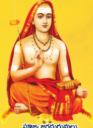
పూజ్య జగద్గురువులు శ్రీశ్రీశ్రీ శంకర భగవత్పాదుల వారు